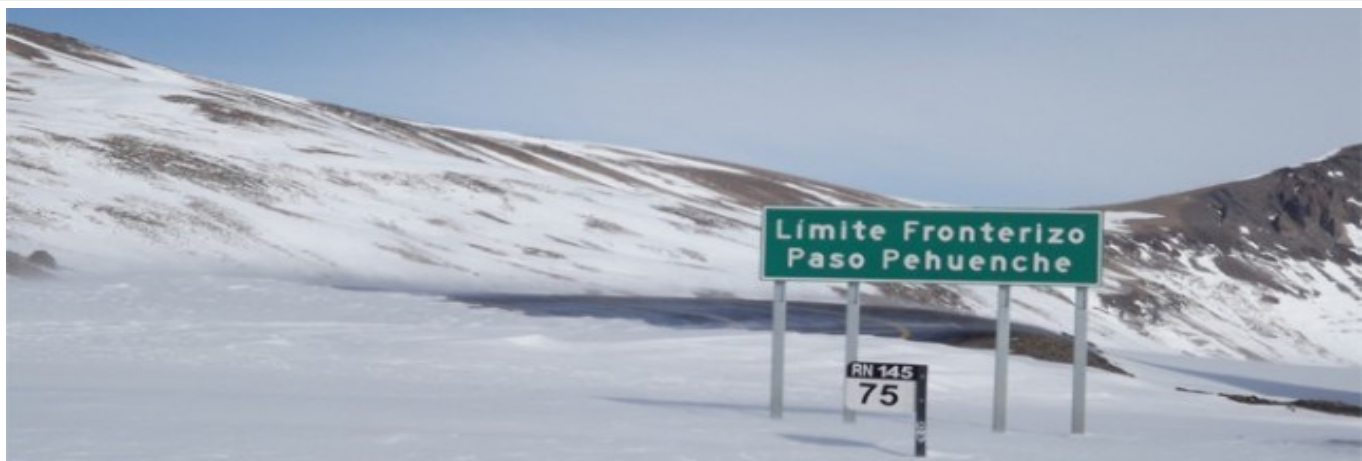
Limite Argentina – Chile Ruta Nacional N° 145 Paso Pehuenche.